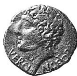
Pièce de monnaie représentant Vercingétorix